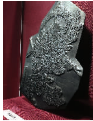
清代的大型佛像版