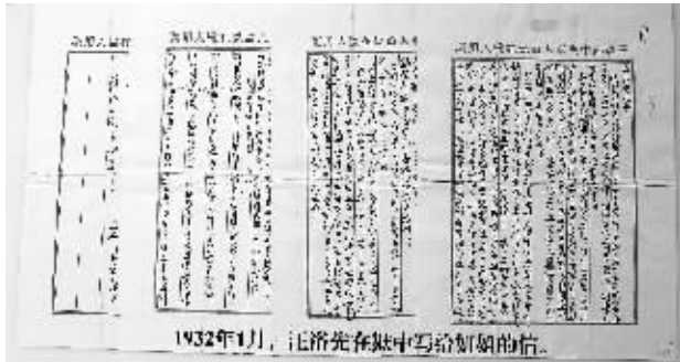
1932年1月,汪裕先在狱中写给姐姐的信