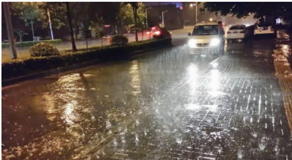
昨晚,徐州已下起大雨