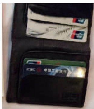
嫌疑人的银行卡,生活费由上家提供