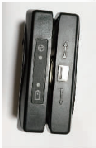
复制银行卡设备只有半个巴掌大