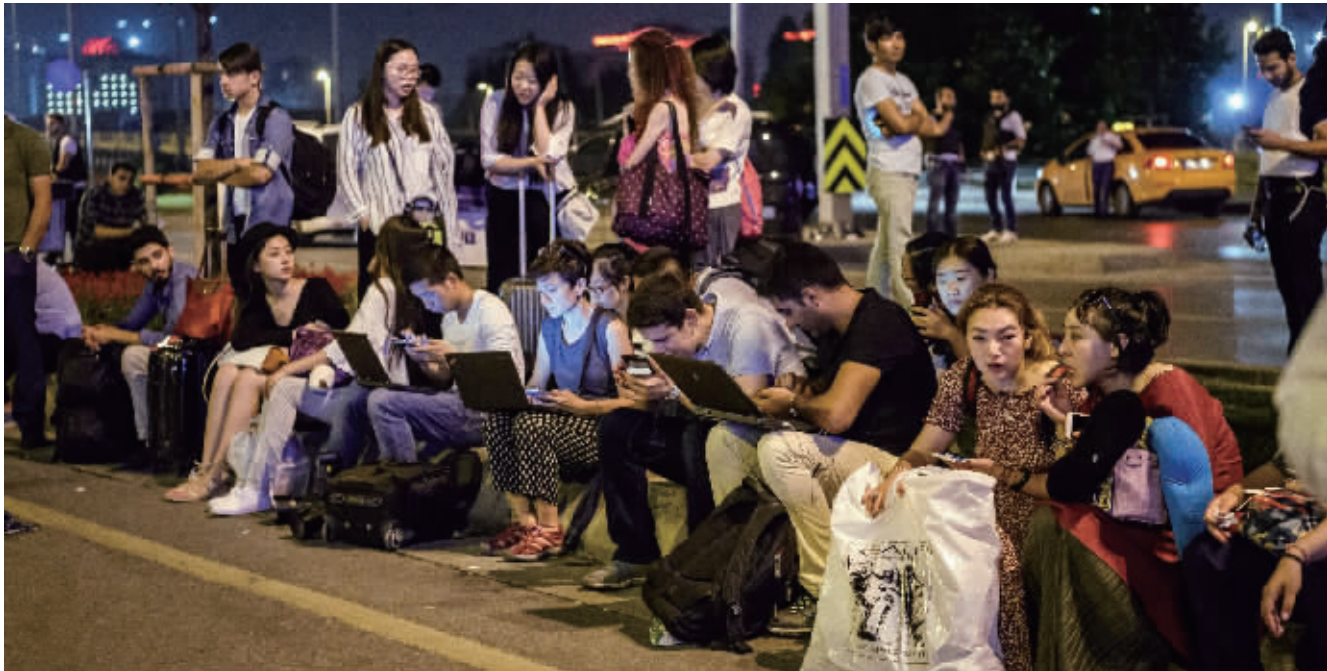
昨天凌晨大批聚集在阿塔图尔克国际机场外的旅客等待离开