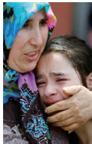
遇难者的家属哭泣

阿塔图尔克机场是土耳其最大的机场,也是国际游客主要中转地。机场航站楼入口处及登机口均设有X光安检和金属检测仪。