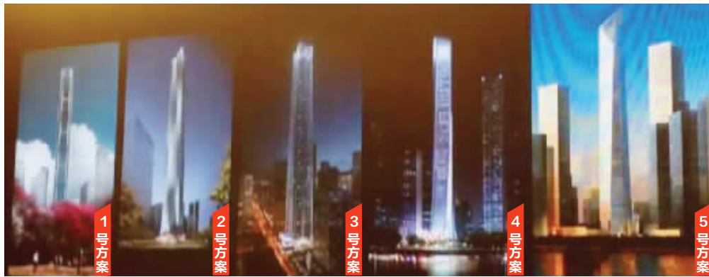
江北新区拟建标志性大楼,网上传出的方案图