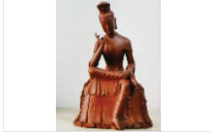
《思维菩萨》清水泥 高28CM