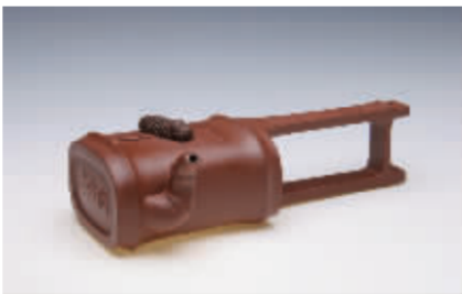
《君竹壶》(毛国强雕刻)清水泥 500CC