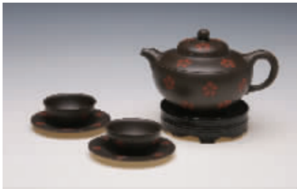
《踏雪寻梅茶具》黑色紫砂泥 350CC

▶此壶以古人“踏雪寻梅”的佳话为设计套壶,新颖别致,匠心独运,将古典意境融入现代壶艺创作中,大方美观,别具神韵。