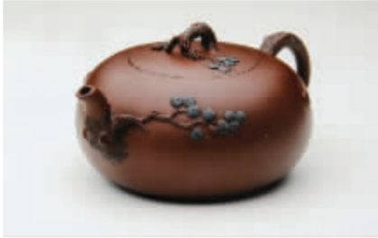
《松情雅趣》原矿底槽清 300CC

▶《松情雅趣》壶采用难度较高的薄胎全手工成型工艺,以品质高雅、坚强的松为创作题材,扁圆形身筒传统而不失新意,松树枝干状的嘴、把、钮的搭配恰到好处。