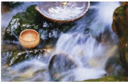
《孕玉套具》老段泥(黑料装饰) 500CC

▶该作品以自然界之河蚌为创作灵感,运用写实的手法,于太湖盛产珍珠、河蚌虽丑,但产出来的珍珠是美玉,取名“孕玉”也!