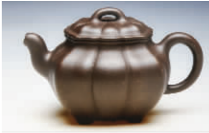
《四面生莲》拼紫调砂 400CC