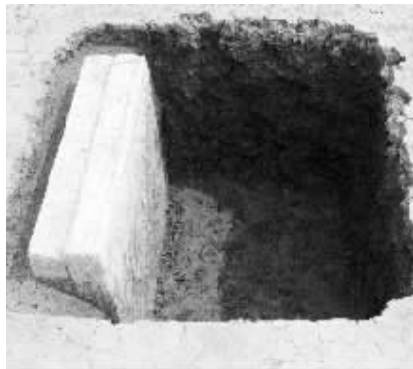
考古现场发现的墓志

在贝琳的职业生中，钦天监漏刻博士、五官灵台郎分别是干什么的？专家介绍，漏刻博士是钦天监下设的，从九品官员，掌管定时、换时、报更、警晨昏等工作，大朝贺时，充报唱官的角色。通俗一点说，就相当于现在的授时中心工作；而五官灵台郎是观测天象变化的，要把观测到的风雷、晴雨、流星、异常天象等一一记录，并上报。