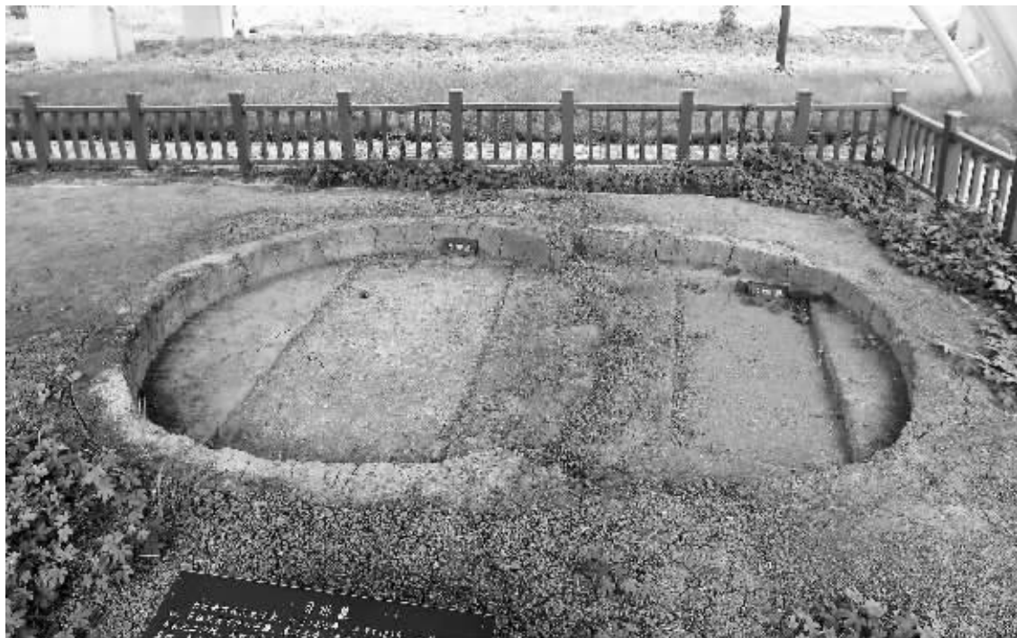
被整体保护起来的贝琳墓

“贝琳墓中没有清理出多少东西。出土了挂在胸前的铜组佩、银币、银耳挖、墓志、地契砖、铜钱等，他妻子的墓中，出土了金币、银簪、铜钱等遗物。”考古队员说，就明朝的官员来说，这真的是寒酸的。