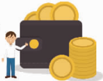
2015年国家统计局公布的全国平均工资数据显示