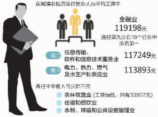
在城镇非私营单位就业人员平均工资中

金融行业、IT行业、水电气行业,都是竞争不充分的垄断行业,历年来一直占据收入前三把交椅。而收入水平较低的行业,也是技术含量较低的劳动密集型,主要是体力劳动为主。