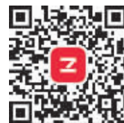
扫描二维码 安装ZAKER客户端

普惠奖(不计人数):除了上述实物奖品外,每邀请一个好友,还能获得ZAKER积分商城150积分,攒积分可换大奖,积分商城里商品种类繁多,图书、智能运动手表、拍立得相机、kindle电子阅读器等应有尽有