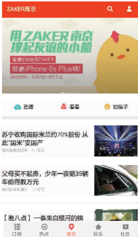
点击页面上方图片,可获取邀请码