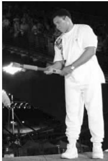
亚特兰大奥运会点燃主火炬的一幕成为经典