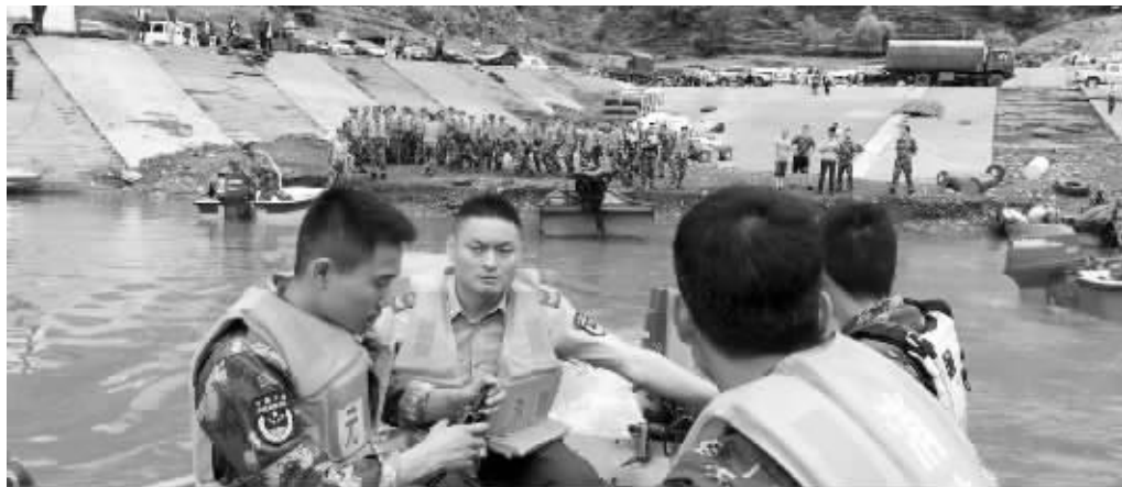
6月4日,广元市消防支队官兵在事发水域进行搜救

记者4日晚从四川广元市委宣传部获悉,4日下午广元白龙湖发生游船侧翻事故,游船实载18人,4人获救,其中1名被救起来的儿童因医治无效死亡,其余14人仍下落不明。