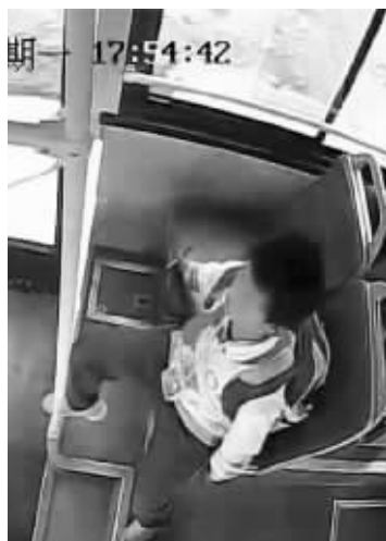
监控显示,“熊孩子”划破座椅

今年5月,3名三年级小学生连续划破昆明公交公司8路汽车的61个座椅皮套,经协商,“熊孩子”家长共同赔偿公交公司修理费用13800元。