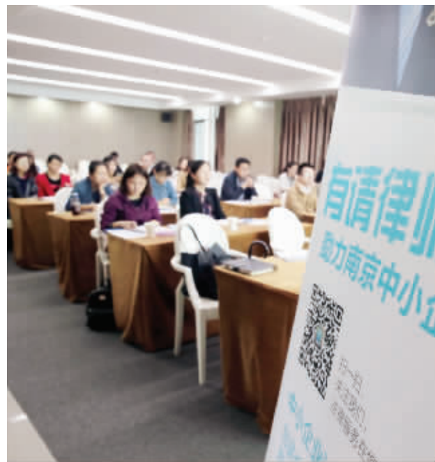
“有请律师”讲座现场

多个创业园区合作,开展中小企业法律服务专项行动,旨在帮助中小微企业增强法律意识、防范法律风险。同时,活动将聘请专业法律服务机构向园区内企业提供法律知识公益讲座和法律咨询、诊断等服务,为企业发展营造良好的法治环境。