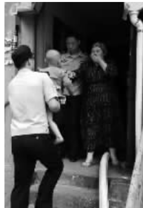
民警抱着救出的孩子