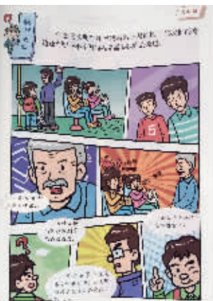
读本封面和里面的漫画

子特征的叙事表达方式,用孩子能接受的方式,把社会主义核心价值观种进心里。“一个个的故事也可以看作一个个脚本,可以化身成课堂情景剧,让孩