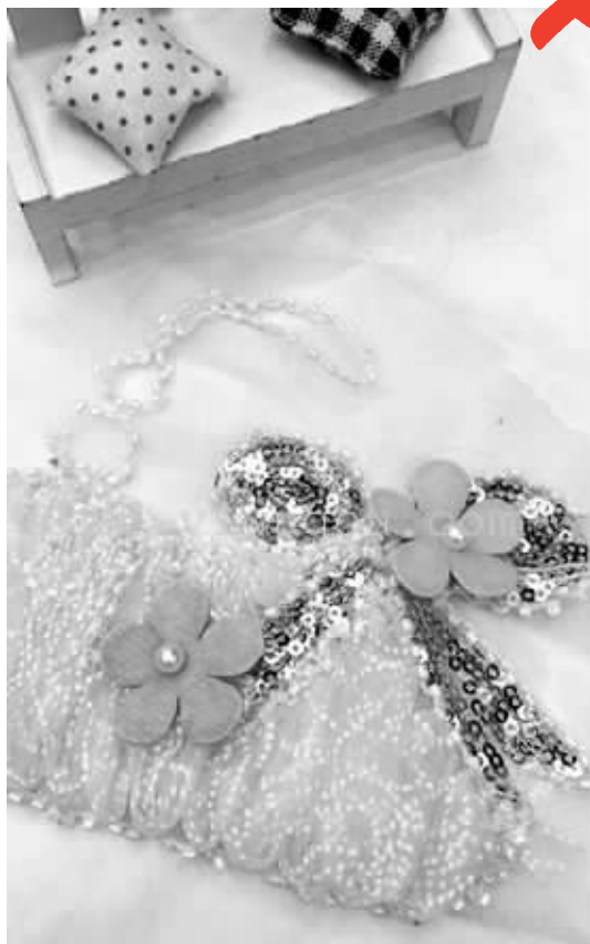
衣服头颈部不能有绳带，金属亮片等装饰也不宜有

昨天，现代快报记者走访了南京新街口的几家商场，童装柜台展示的大多是夏装，以T恤和衬衫为主。偶尔有连帽的冲锋衣、小风衣之类的，帽子与衣服之间也是以拉链连接。营业员告诉记者，“春秋天的时候有卖连帽卫衣，那上面可能会有绳带。另外，冬天的羽绒服带子会多些。”在淘宝网上，记者注意到，有商家卖的儿童连帽防晒衣是有绳带的，很长，不打结的话一直拖到胸口，买的人还不少，销量近700件。