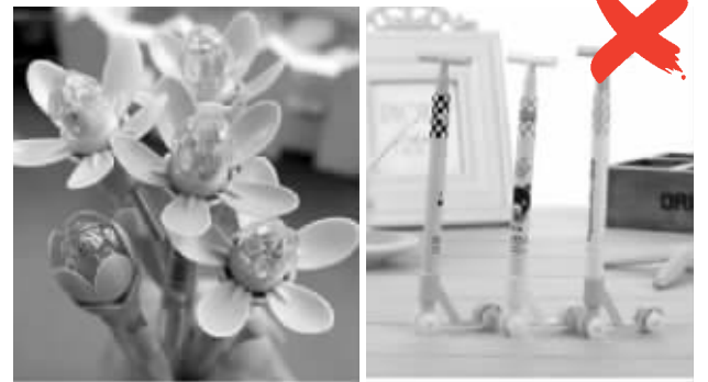
尽量别购买造型独特的笔

文具是每个学生都要使用的日常消费品，不过，近期，国家质检总局缺陷产品管理中心组织对市场上销售的笔类文具调查时发现，一些造型独特或