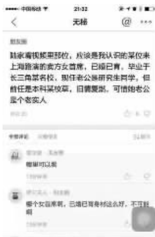
网传人肉信息涉无秘平台