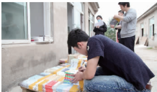
办案人员正在登记盗版书籍