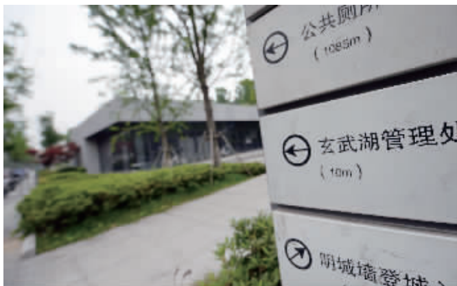
离建筑不远处的指示牌上,标明“玄武湖管理处”,但实际上并未移交