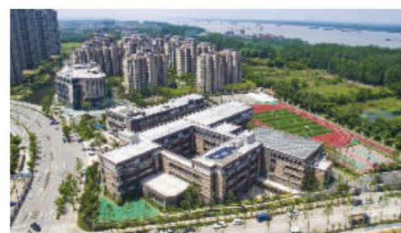
生态科技岛小学今年9月开办