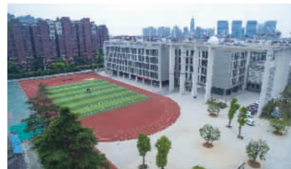
南湖二中完成校安工程整体出新