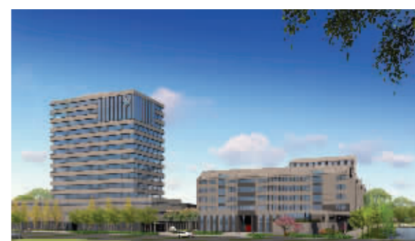
莫愁职校南部新校区今年启动建设