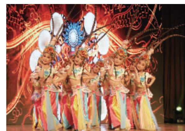
莫愁湖小学学生表演古典舞《俏花旦》

“十三五”期间,建邺区学前三年教育毛入园率达100%,义务教育入学率、巩固率达100%,高中阶段教育毛入学率达100%,高等教育毛入学率达75%,从业人员继续教育年参与率达90%,国家教育信息化标准达标率达95%。健全国民教育、终身教育协调发展的两大体系,教育对区域发展的贡献度、群众对教育的满意度不断提升。