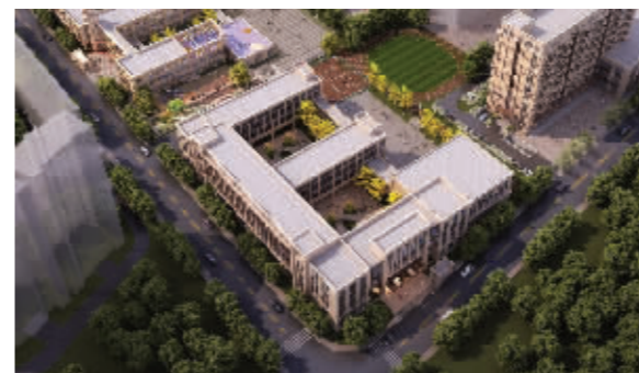
新城小学怡康街分校今年9月开办