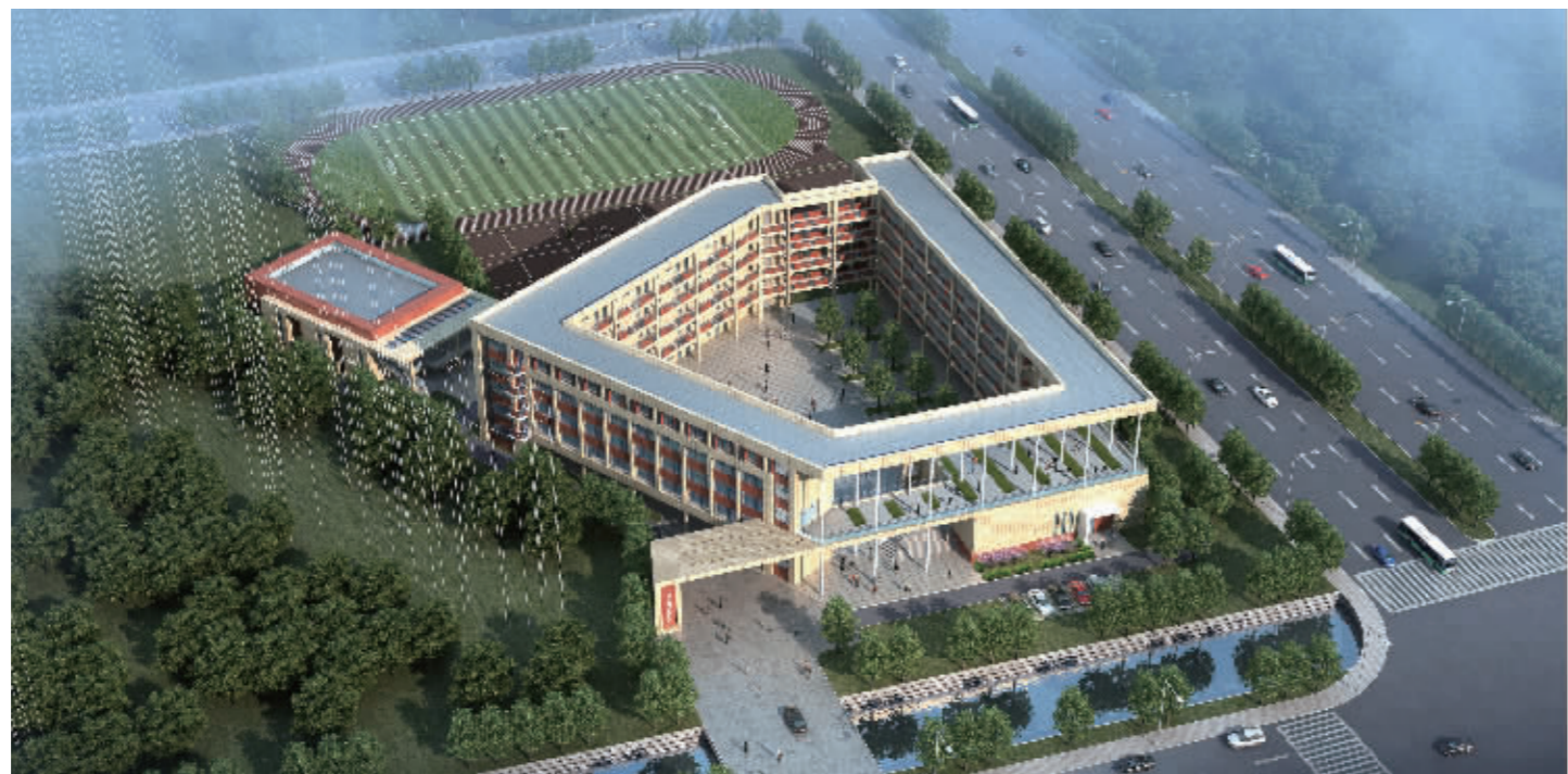
南京致远初中今年9月开办