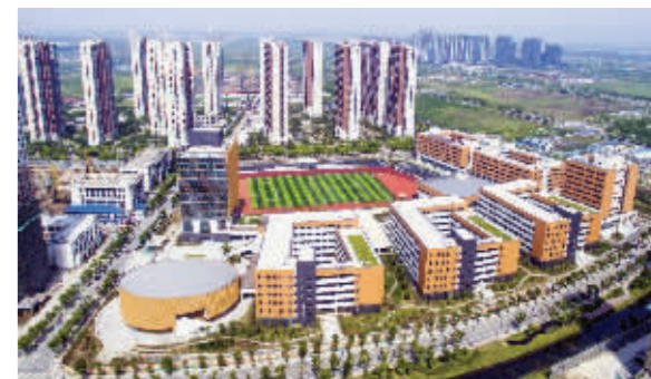
南京河西外国语学校今年9月开办