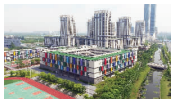
南外青奥村小学今年9月开办