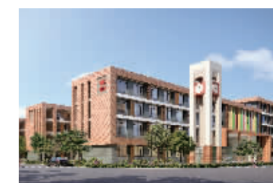
规划建设中的积善小学

规划配套32所幼儿园,其中新建开办10所左右。新建开办中小学19所,其中中学(含高中)7所、小学11所、职业学校新校区1所,同时规划配套中小学校16所。主要分布在河西中部、南部和江心洲地区,届时全区各类教育布局将基本完善,教育体系更加完备。