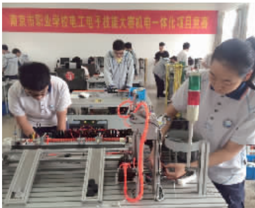
南京市职业学校电工电子技术技能大赛机电一体化项目竞赛