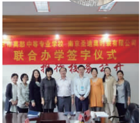
连锁经营管理联合办学