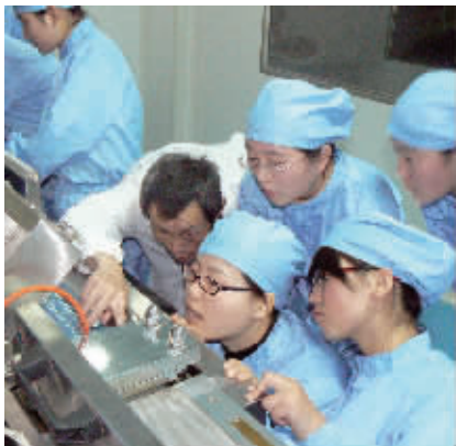
药物制剂综合实训