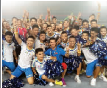
青奥会上我们朝气蓬勃