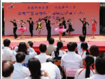
体育舞蹈专业学生在南京首届职业教育活动周表演