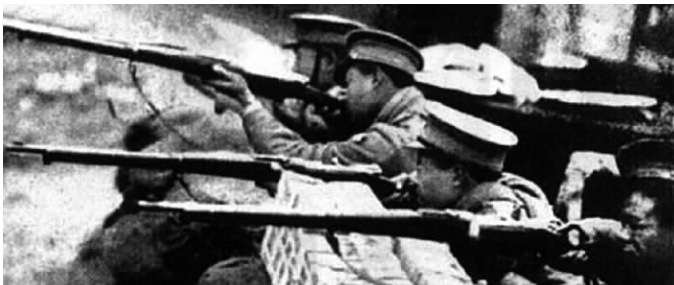
抗战中的宪兵(资料图片,与本文无关)