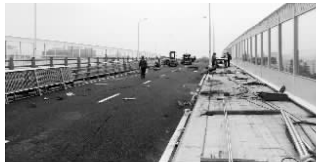
立交桥上,工作人员正在进行收尾作业

快报讯(记者 刘伟娟)自南京站北广场启用以来,南、北广场不通的问题,一直成为铁路和公路无缝对接的一个障碍。由此,作为连接南京站南、北广场的通道,世纪东路上跨铁路立交桥的建设备受关注。昨天,现代快报记者从现场获悉,该立交桥已经建成,有望这个周末通车,时间初定在5月28日这天。