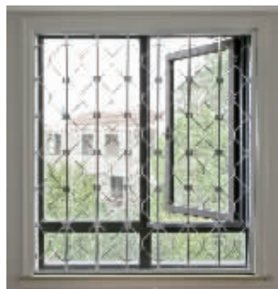
▲防盗窗的室内拍摄图

现快报电商特推出目前市面上具有先进技术的新型折叠防盗窗，这款新型折叠防盗窗是具有国家发明专利产品(专利号:ZL02110917.6)，设计新颖、独特，制作工艺精良，外观典雅超凡，内置安装，自由开启，视线毫无遮挡。防盗、护童、消防、方便性能高。