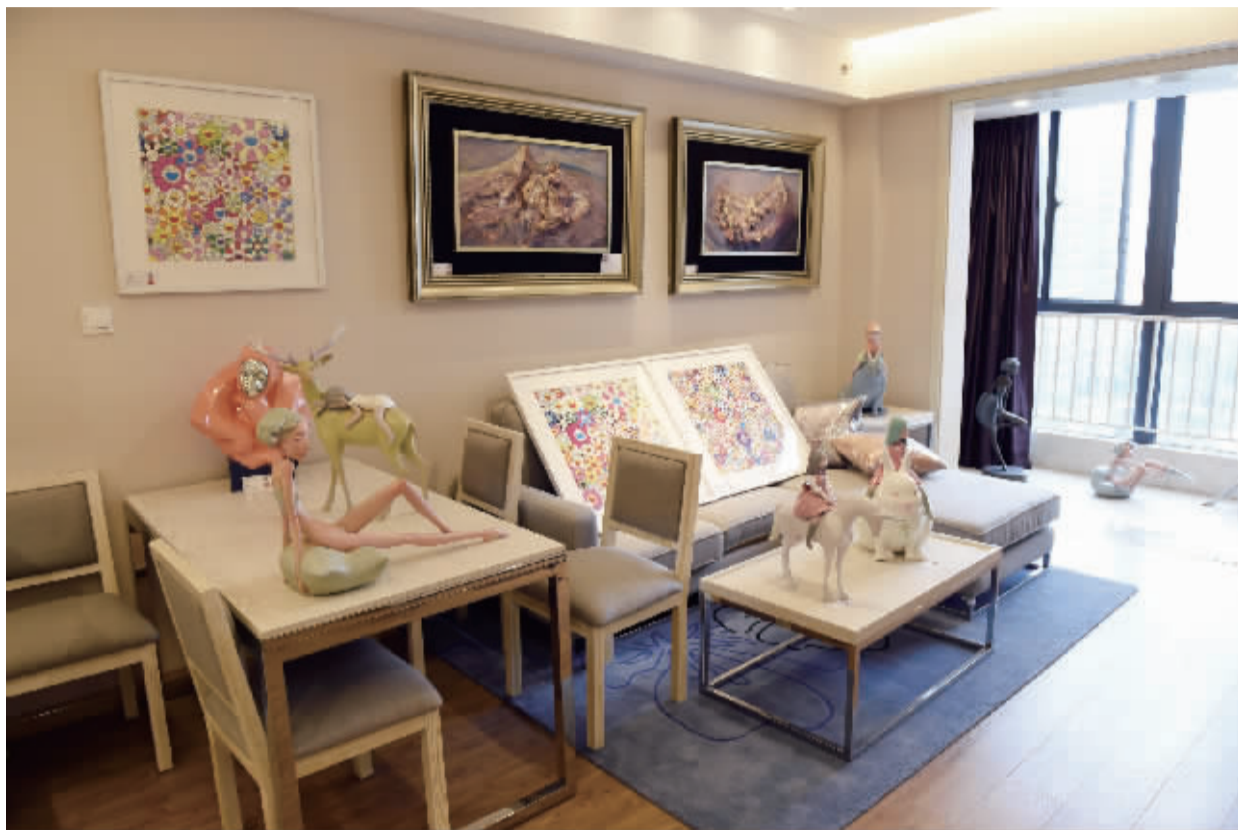
现代快报艺加文投展示间部分展品