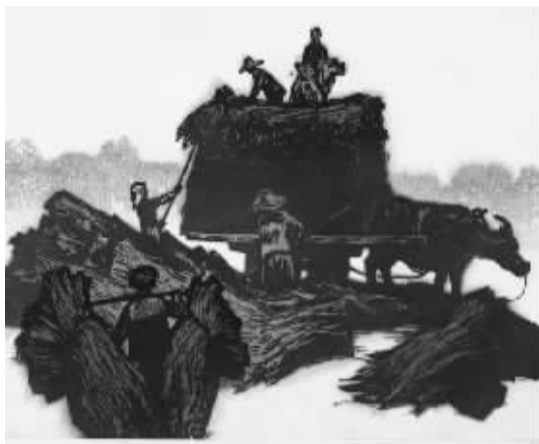
吴俊发版画作品《秋》

应章剑华之邀,89岁高龄的我国著名版画艺术家吴俊发先生,在夫人的陪同下来到省文联办公室。一进门,吴老就被墙上的一幅鲁迅画像所吸引,他说这幅画是根据一张鲁迅先生与版画家谈话时的照片创作的,鲁迅先生对中国近代版画的兴起和发展起到了重要作用。他们的谈话便由此开始。