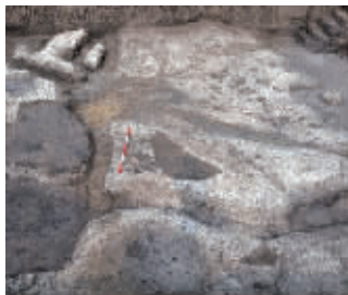
距今8000多年的稻田遗迹 资料图