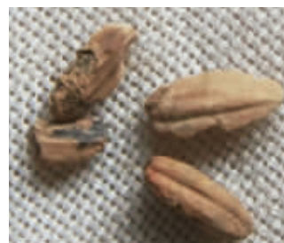
韩井遗址中发现的水稻种子 资料图