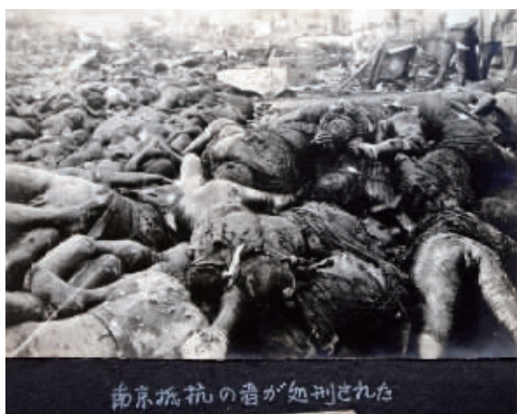
侵华日军南京大屠杀暴行令人发指