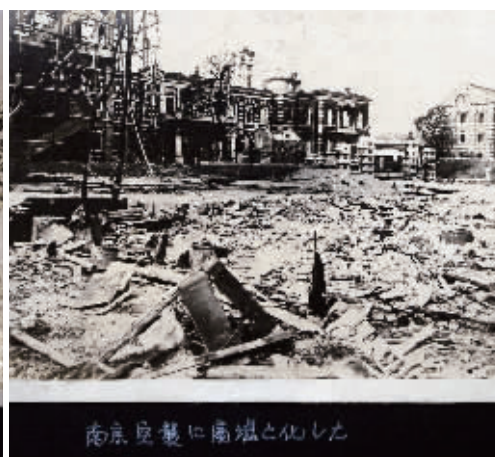
空袭使南京变成了废墟,地点应该是湖南路