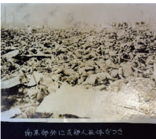
照片注明“南京郊外的中国人的尸体”,地点应该是汉中门