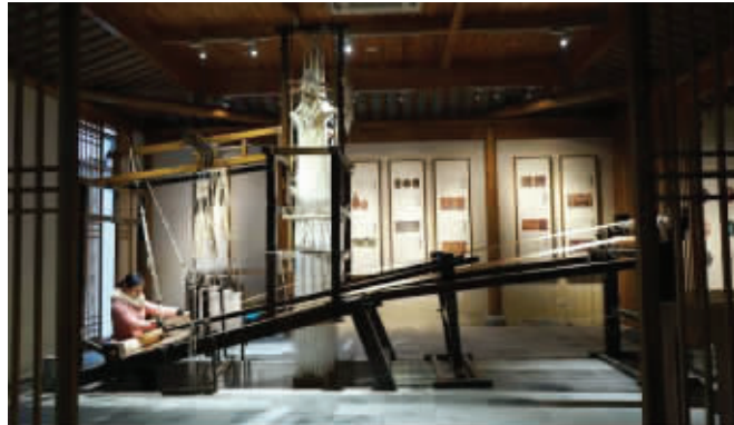
博物馆历史馆内设织染坊场景