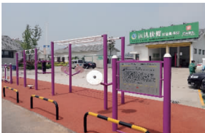
仪征高速服务区试点建成的健身广场

据悉,首批健身广场将在年内开建,并开创国内先河。如果江苏试点成功,有望在全国推广。