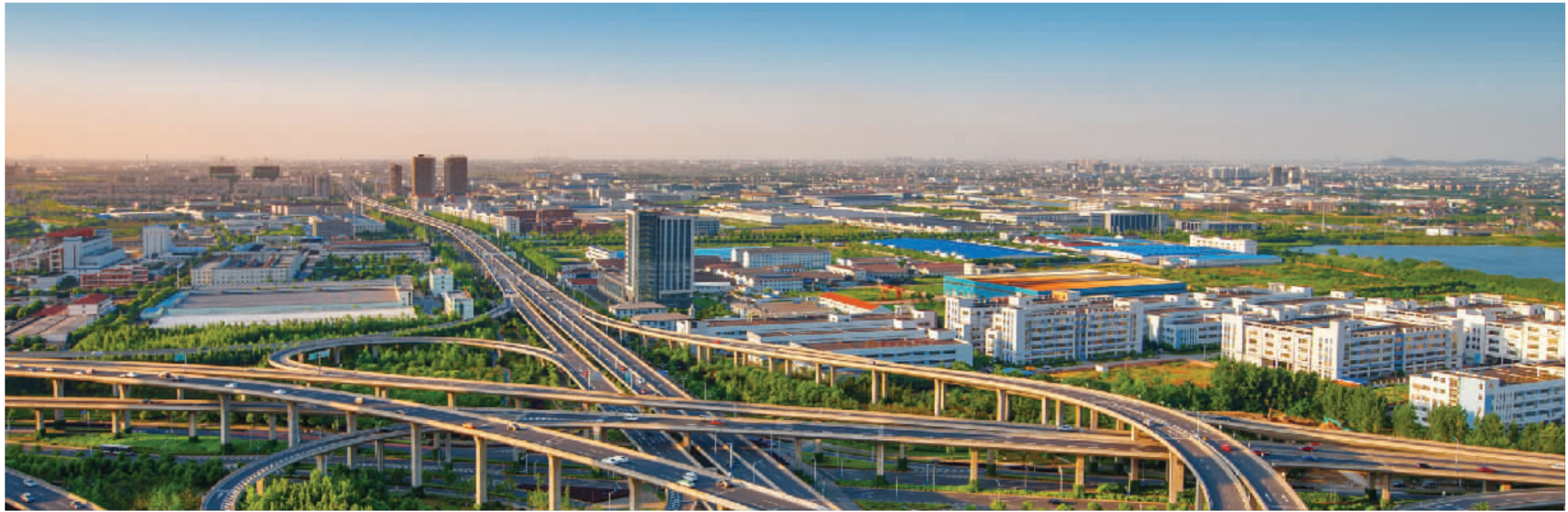
一批投资规模大、带动性强的重大项目正在高架沿线加速推进