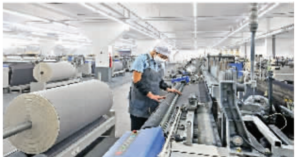
纺织工业开启全新时代

作为一家国际品质的超级电容器生产商、超级电容系列及应用方案提供商,集星科技超级电容产品已在风能 and 太阳能、新能源汽车、轨道交通、智能电网等众多行业领域得到广泛应用。此次由集星科技在常州成立超级电容和储能技术研究院,将集中研发突破超级电容制造的尖端材料瓶颈,并在近期规划研发高性能小型超级电容器、MEMS微型超级电容器、可穿戴柔性超级电容器等国际领先技术。