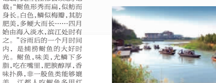
姜堰溱湖国家湿地公园