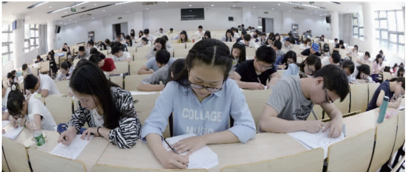
来自全国各地的选手参加笔试