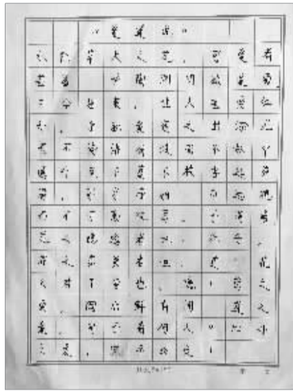
无锡宜兴洋溪中学 吴菲作品 指导老师:曹萍