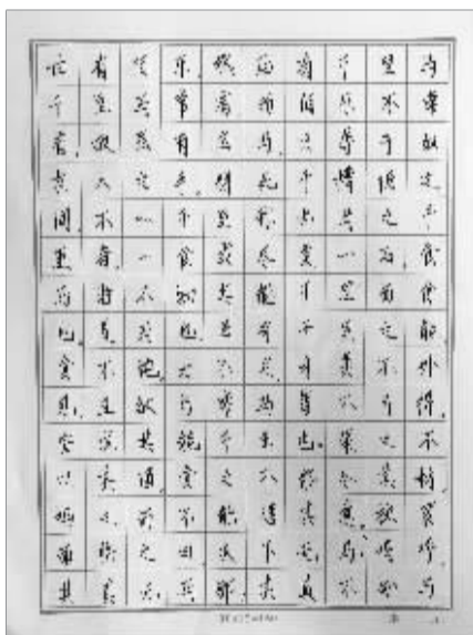
无锡宜兴洋溪中学 韦婷作品 指导老师:朱锡明