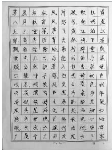
无锡宜兴洋溪中学 胡欣平作品 指导老师:周立云