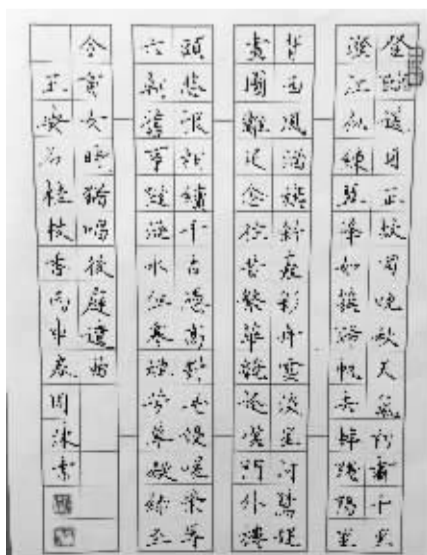
镇江市京口实验小学 周沫作品 指导老师:钱俊