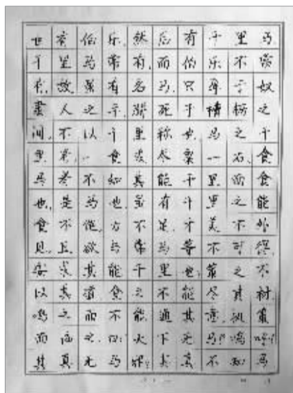
无锡宜兴洋溪中学 张洁作品 指导老师:黄建斌