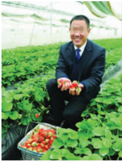
被称为“草莓书记”的叶剑生 资料图片