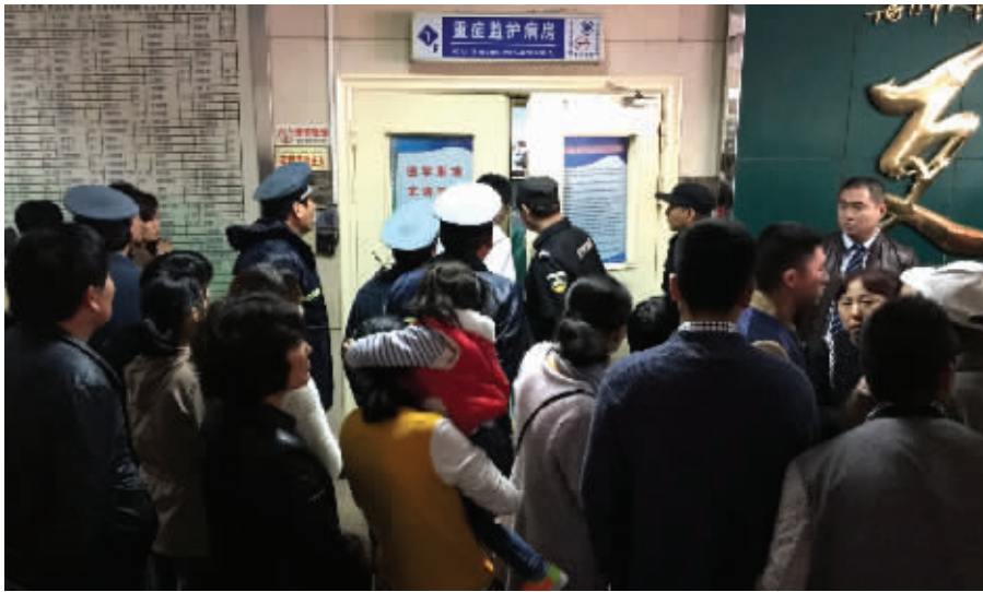
海门市人民医院的重症监护病房门口挤满了人