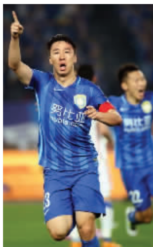
本场就看苏宁本土球员的发挥了