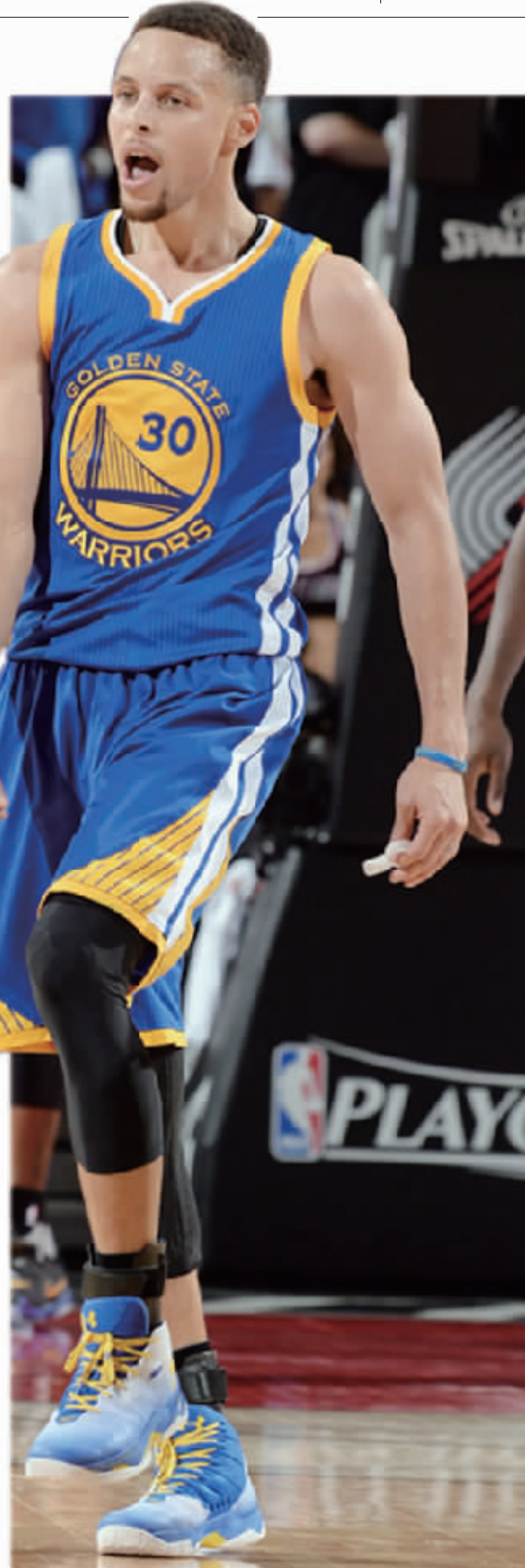
加时赛库里打疯了