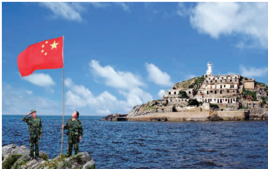
全国时代楷模——王继才王仕花夫妇 资料图

前,灌云已有各类志愿者11万余人,今年以来新建55支志愿服务团队,累计开展志愿服务400余次,服务总时长达4500小时。此外,灌云县还在志愿服务平台专门设计了一个“寻求帮助”栏目,做到群众有所需,志愿有所应,提高了志愿服务活动生命力和群众认可度。如今在灌云,志愿者已经成为了一个非常时髦的身份,志愿服务也成了一个个响亮的品牌。