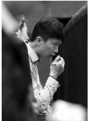
昨天上午,2016年江苏省考试录用公务员面试拉开大幕