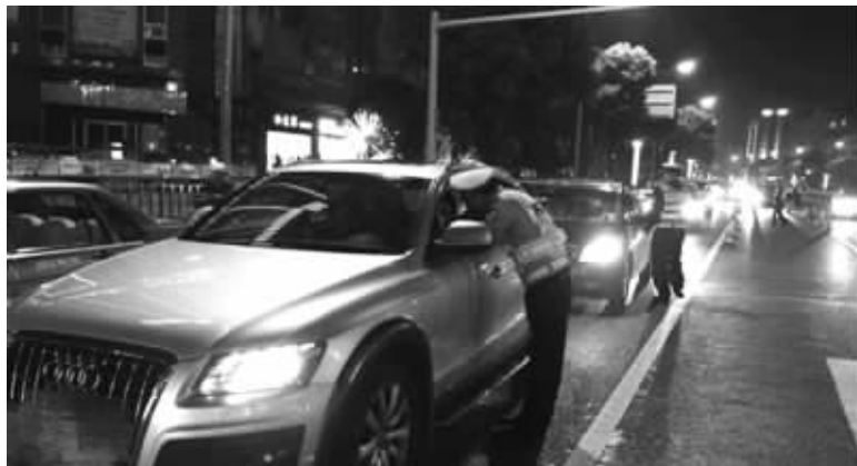
交警开展酒驾醉驾集中整治