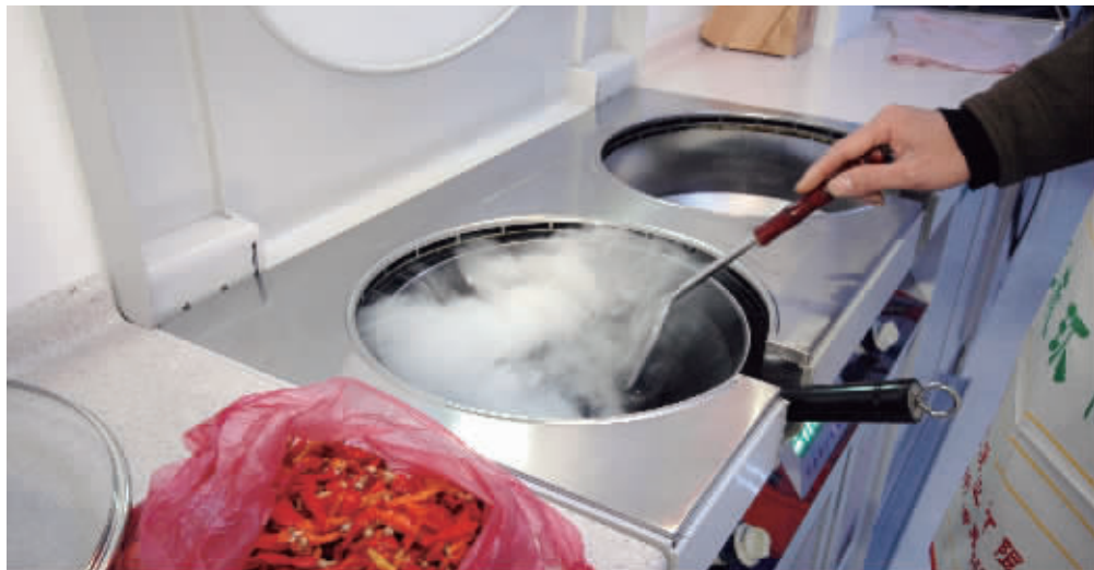
炒菜时如果油锅起火,应用锅盖盖住油锅