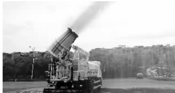
“大炮”的射程还挺远

快报讯(通讯员 周魁 丁勇 记者 杨菲菲)车前冲水,车后洒水,两侧淋水,车上还有一个“炮筒”喷雾……昨天上午,在江宁区文靖路附近,现代快报记者看到了这辆多功能抑尘车,因为车身上有一个发射喷雾的“炮筒”,这辆车也被工作人员称作“大炮”。据了解,这是江宁区购买的第一辆多功能抑尘车,也是南京市