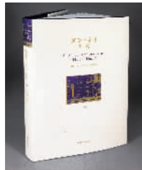
《查令十字街84号》珍藏版

“外界只看到收获采摘的时刻,看不到前期的培育。我们还是相信品质,相信好东西的生命力。”她为记者举了几个例子——《朗读者》,译林于2000年独家中文版权出版简体中文版,2009年根据这本书改编的电影获奥斯卡奖项。《少年Pi的奇幻漂流》,译林2005年独家版权出版简体中文版,2012年李安同名大片上映,2013年获奥斯卡奖。《查令十字街84号》,译林2005年独家版权出版简体中文版,该书成为2016年汤唯吴秀波大片《北京遇上西雅图2》的核心元素。她表示,译林社的“幸运”根植于对某种理念的坚持。那个理念就是,要做真正有价值的书,做能够流传下去的书。