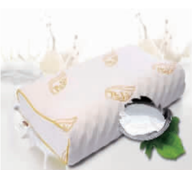
购买泰国乳胶枕,均配有可拆洗枕套(枕套如上图)

枕头是我们睡觉时最密切的伙伴,但是这个伙伴如果不妥,比如太高、太低、太硬、太软或者弹性过强,都会影响我们的睡眠质量。