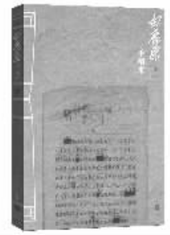
《白鹿原》手稿限量版封面