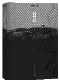
《白鹿原》20周年纪念版封面