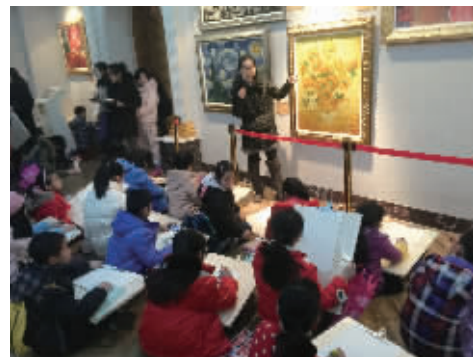
第二课堂——我在博物院上美术课