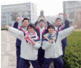
南京市高中研究性学习成果评比一等奖