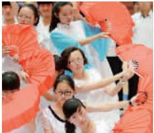
校园体育舞蹈比赛