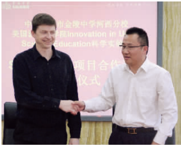
奥巴马座上客波士顿学院迈克尔·巴奈特教授受朱校长之聘担任学校课程顾问

学部注重班集体建设,以健康进取的班风引领学生,鼓舞学生。同时,高中部着力于家校沟通,每个年级都成立了“级务委员会”,通过定时沟通和研讨,与家长展开对话和合作。