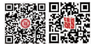
微信二维码 校园网站二维码

温馨提醒:学校将于2016年5月15日举办大型招生咨询会,欢迎广大初三家长、学生前来咨询。 地址:建邺区兴隆大街208号