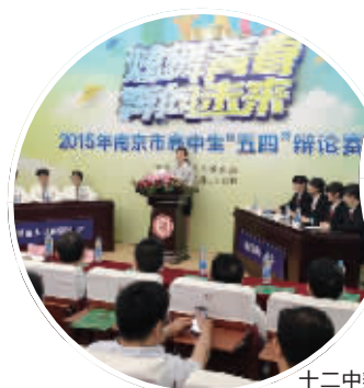
十二中辩论队舌战南师附中辩论队

十二中社团活动贴近学生生活,形式新颖,内容丰富,深受同学们的喜爱。规模影响较大的还有马吉爱心社、春江文学社、励志健身社等,其中“马吉爱心社”深入社区、医院、地铁站、图书馆等地,献出爱心,收获自信与感动,演绎不一样的青春,展现了十二中学子崭新的时代风貌。