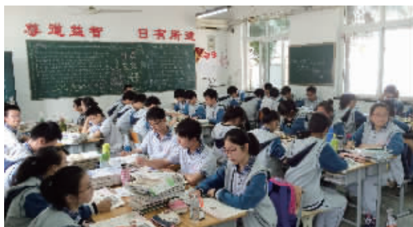
小班化教学让学生充分地自主学习