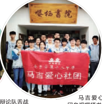
马吉爱心社团参观曝书楼