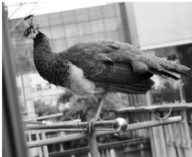
这只雌性蓝孔雀意外飞进了社区

老伯,这只孔雀很可能是附近居民家养的,建议他不要惊扰孔雀,让它过段时间自行“回家”。