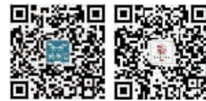
扫描二维码 了解汉字听写大会相关信息

本周六,个人赛和校园PK赛中胜出的优秀小选手们,将齐聚句容碧桂园IB国际学校,参加江苏省冠军赛。最终5名胜出的选手能跟着自己的老师一起去央视,和全国各地最会写汉字的小选手们一起比拼。