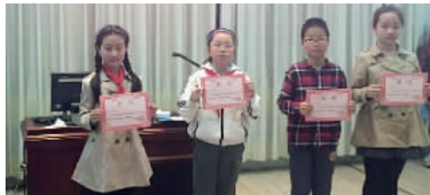
金陵汇文学校小学部胜出选手

快报讯(记者 徐萌 黄艳)现代快报独家承办的央视“2016中国汉字听写大会全国巡回赛江苏赛区校园选拔赛”,已经进行了校园PK赛和个人赛,胜出的小学生们将在本周六(4月30日)参加“2016中国汉字听写大会全国巡回赛江苏省冠军赛”,角逐5个到央视比赛的机会。